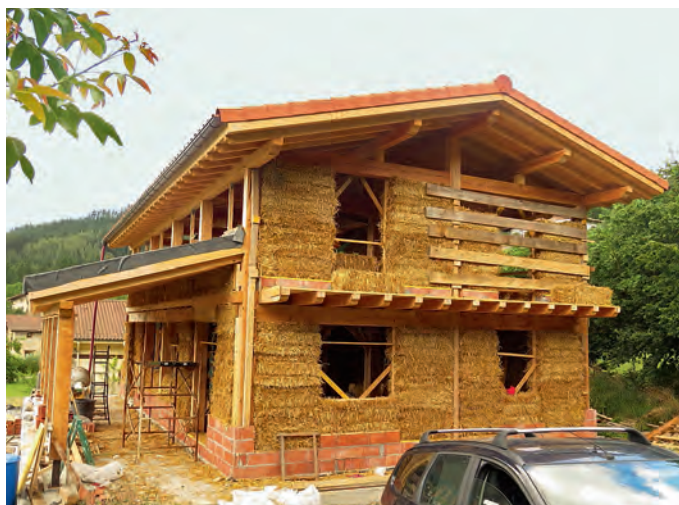
© EKAITZ URIBE RUS Y NAGORE TOLOSA IRAZUSTA

La paja es un material sostenible, ya que su puesta en obra no genera residuos y es perfecto para la construcción y rehabilitación de viviendas. A la izquierda, proyecto de construcción circular de 150 m 2 útiles con muro de carga de paja "jumbo", de 1,20 m de espesor y cubierta recíproca de madera maciza, realizado en Arbizu (Navarra) por el arquitecto Iñaki Urkía. Abajo, vivienda en Igorren (Vizcaya), proyecto de Ekaitz Uribe Rus y Nagore Tolosa Irazusta (Oreka Arkitektura).